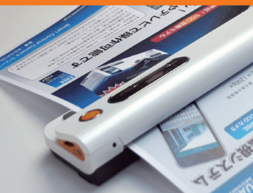
カラー、モノクロでスキャンできます。