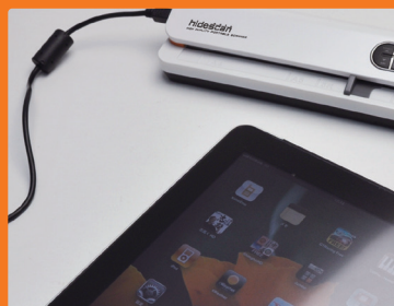
iPad、iPad2でも利用出来ます。