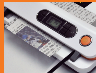
新聞の切り抜きも大事にスキャン。