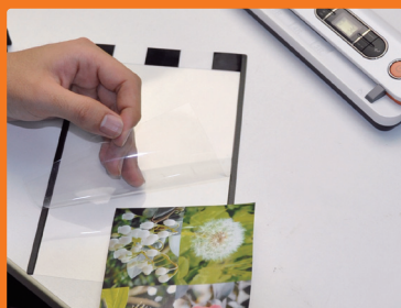
写真は専用プロテクトシートにはさんでスキャン。